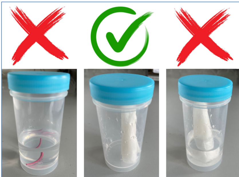
Abb. 1: links: Nerv (Gummiband für die Darstellung) in schwimmender Lösung. Mitte: mit NaCl getränkter Tupfer. Rechts: in Flüssigkeit schwimmender Tupfer.